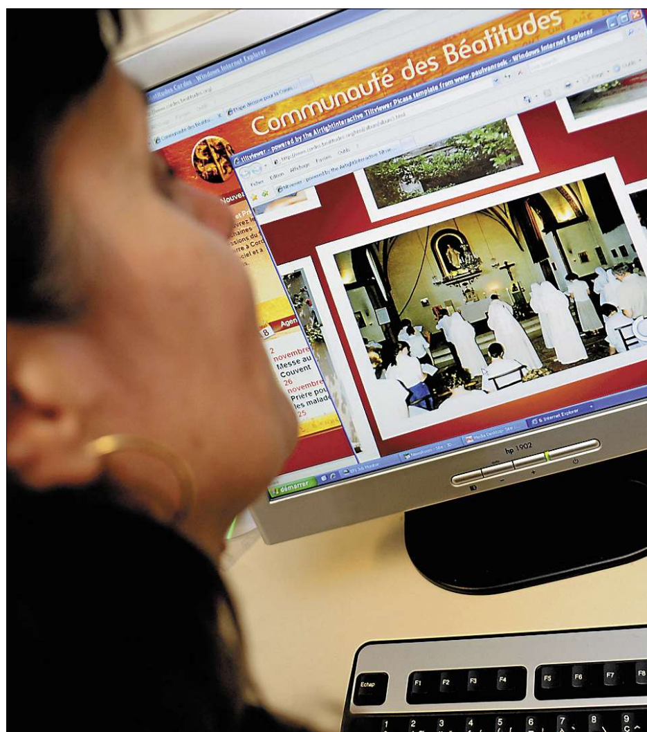
La communauté des Béatitudes est présente dans trente pays.

Même si Sylvain Ponga a, selon l'église,